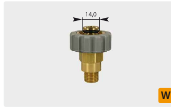
Стандартное M21 : AG. Серое. Макс. 400 bar / 150 °C