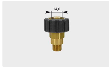
Стандартное M22 : AG. Черное. Макс. 400 bar / 150 °C