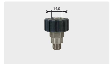
M22 : AG. Нерж. сталь. Макс. 500 bar