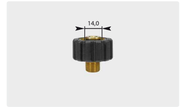
Короткое M22 : AG. Черное. Макс. 400 bar / 150 °C