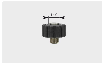
Короткое M22 : AG. Нерж. сталь. Макс. 400 bar / 150 °C