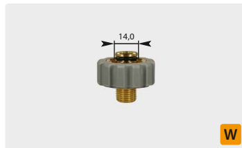
Короткое M21 : AG. Серое. Макс. 400 bar / 150 °C